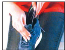
8. The Foot Balance Medical expert ensures that the customer's footwear is perfectly. Foot Balance custom insoles are now ready to use. Additionally, an individual training programme can be specified for the customer.