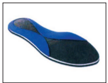
7. Custom wedges will be added, if needed.