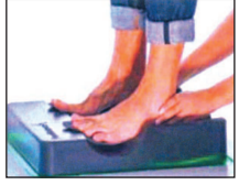
5. The heated insoles are moulded to each foot individually while at the same time maintaining correct foot alignment.