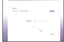
4. A personalis report of the foot analysis is sent to the customer by email.