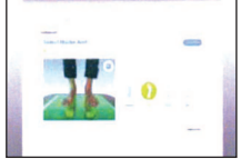
3. Pictures are taken of the feet and prodscope.