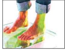
2. Feet are analysed with the use of prodscope.