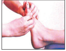
1. The Foot Balance Medical expert carries out a manual examination