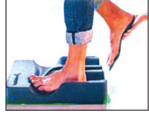
6. After each insole is individually moulded they are checked to ensure they conform perfectly to the natural arch of the customer's foot.